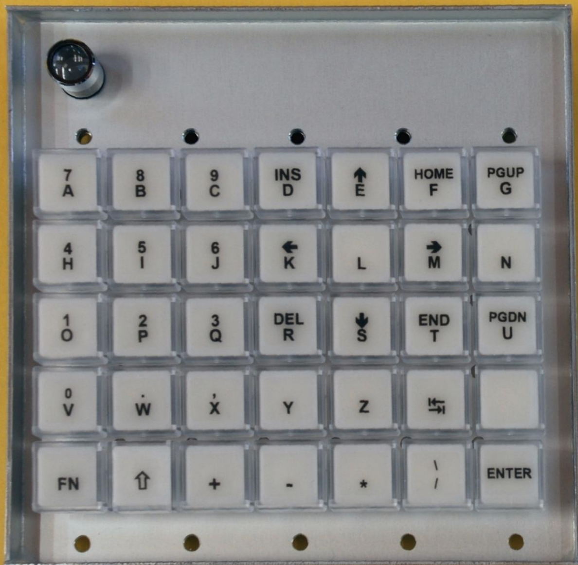
IK810LT-02 Lochblechmodul von vorne